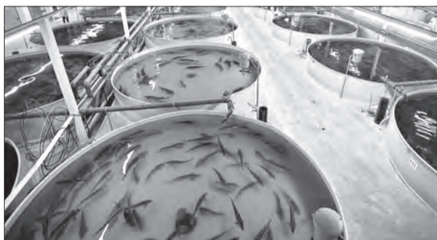
В сельхозакадемии есть специалисты, которые участвуют в работе по развитию сырного, картофельного кластеров и кластера аквабиокультур

час монтируется производственная линия. Здесь студенты получают навыки работы на предприятиях сырного кластера.