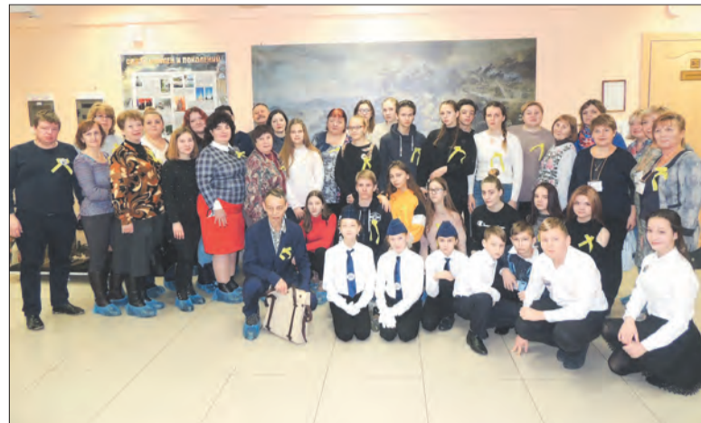
Участники встречи в Северной столице

Впечатления от автобусной экскурсии по «Дороге жизни» отозвались болью и горечью в душе каждого ее участника. По обеим сторонам дороги протяженностью более сорока километров стоят мемориалы и памятные знаки, рассказывающие