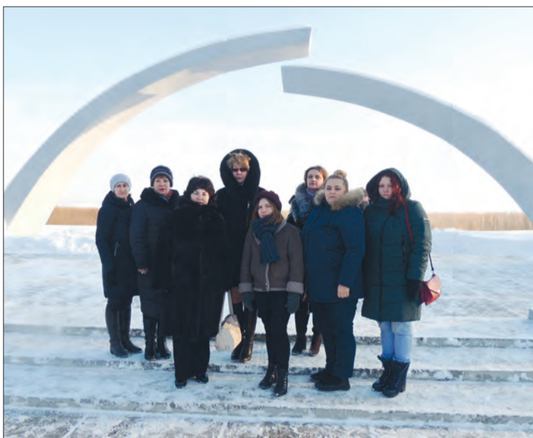
У мемориала «Разорванное кольцо» на Ладоге