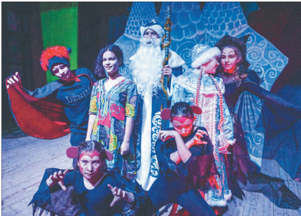
Сцена из новогоднего спектакля

Все артисты хотят получать роли, участвовать