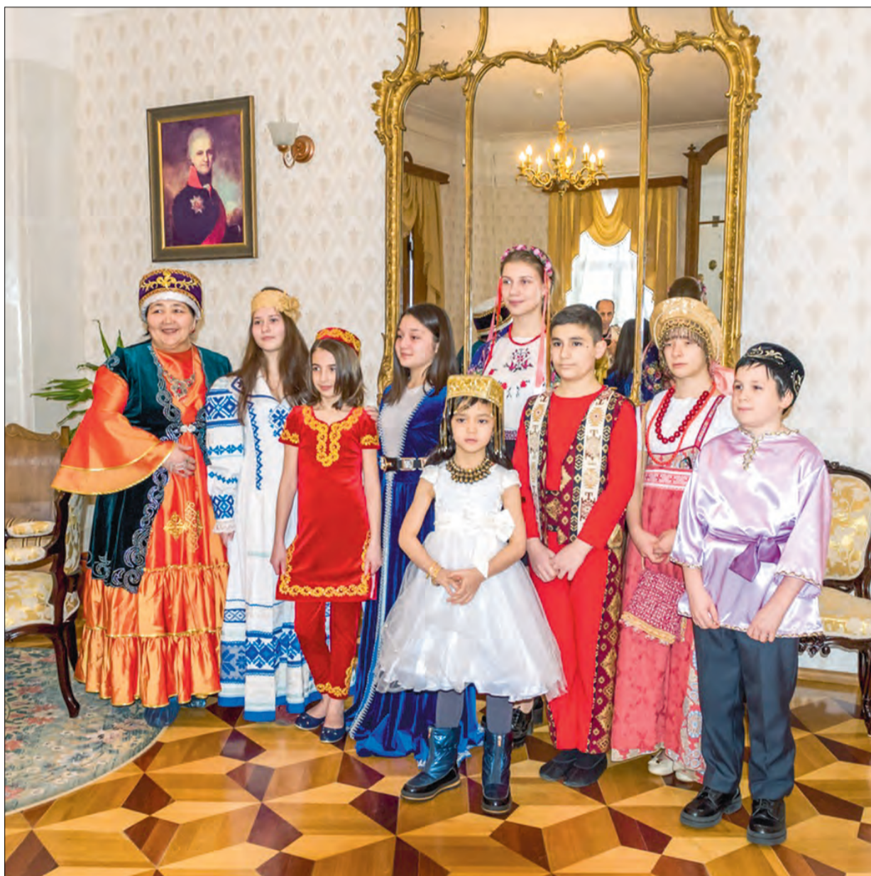
Юные ярославцы читают стихи русского классика на разных языках

Поэтический праздник был приурочен к Международному году языков коренных народов, которым объявлен 2019 год.